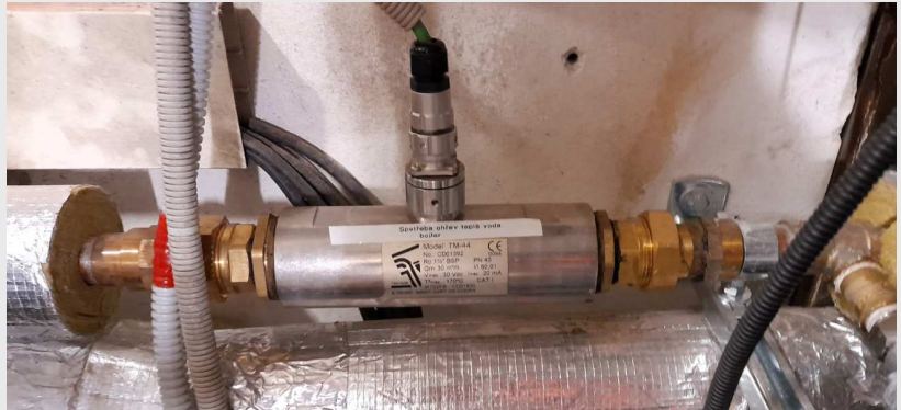
Průtokoměr TM44 DN40 PN40

měření průtoku horké vody, DN25, DN40, DN80, DN100 max +120 °C / 6 barG