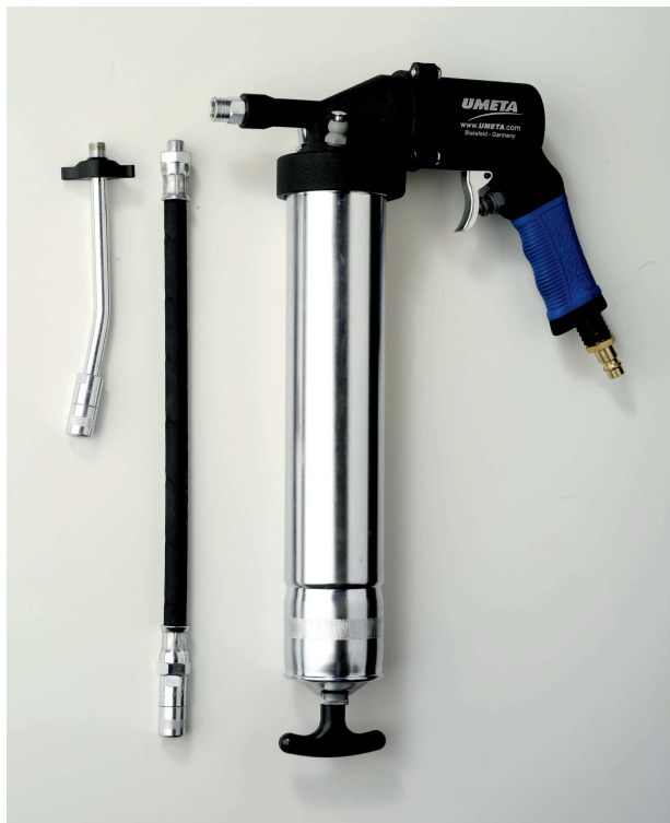
Pneumatický mazací lis DRP 30, obj.č. 32111

Zapsán do obchodního rejstříku u Krajského soudu v Ústí nad Labem v oddíle C, č. vložky 274