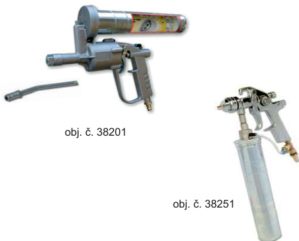
obj. č. 38201