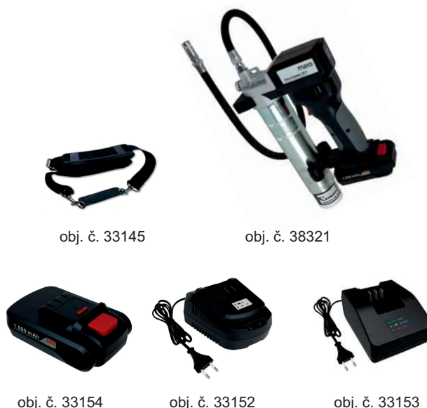
obj. č. 33145

obj. č. 33154....Akumulátor pro AccuGreaser 18 V obj. č. 33152....Nabíječka pro AccuGreaser 18 V-230 VAC obj. č. 33153....Nabíječka pro AccuGreaser 18 V-12/24 VDC obj. č. 33145....Ramenní popruh